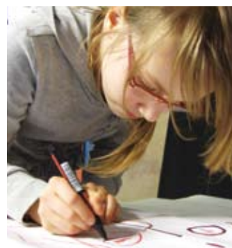
Schülerfirmen: Bildung und Geschäft zusammen

„Schüfis“ haben in der DKJS eine lange Tradition. Eine feierte in Sachsen gerade ihr 13-jähriges Bestehen. Das Jubiläum der Medienwerkstatt S-GmbH in Bischofswerda zeigt: Für viele Schülerfirmen ist wirtschaftliches sowie langfristiges Wirken selbstverständlich – auch wenn die Belegschaft durch den Schulabschluss wiederholt wechselt. 13 sächsische Schülerfirmen gestalten ihre Berufsorientierung nun noch lebensnaher. Seit Anfang dieses Jahres kooperieren sie mit Unternehmen in ihrer Region. Das Modellprojekt Unternehmen als Partner von Schülerfirmen (UPS) regt die Zusammenarbeit zwischen Wirtschaftsbetrieben und Schülerfirmen an; die DKJS begleitet und moderiert die Partnerschaften, um das gegenseitige Verständnis zu fördern und die Geschäftsideen