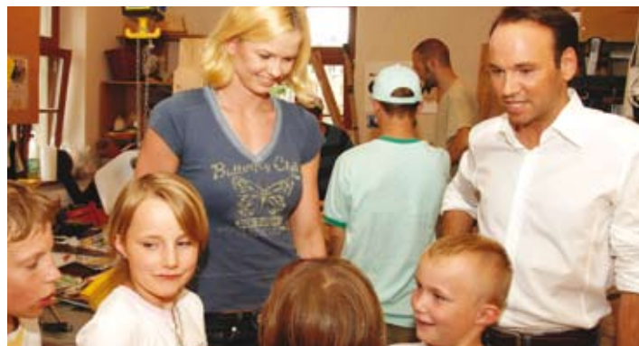
Doppel-Goldmedaillen-Gewinnerin Britta Steffen in der Taschengeldwerkstatt in Dresden

Ganz besonders freue ich mich immer auf die Projektbesuche. Bei der Übergabe des Lichtpunkte-Zertifikats erlebe ich die einzelnen Initiativen hautnah. Häufig präsentieren die Kinder und Jugendlichen zu diesem Anlass erste Ergebnisse aus der Projektarbeit, wie Theateraufführungen, Konzerte oder Ausstellungen. Alle sind dann sehr stolz auf ihre Leistung. Zu Recht! Und dann die zufriedenen Gesichter zu sehen, ist großartig. Es ist beeindruckend, wie viel lokales Engagement bewirken kann.