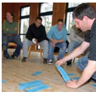
Lernen abseits der Schulbank: o.camper im DJ-Workshop

ken, Vorlieben und Fähigkeiten nicht kennen, weil sie nie danach gefragt wurden, die sich aber schon bald für eine Ausbildung entscheiden sollen, die zu ihnen passt? Die Erfahrung der DKJS zeigt, dass für sie die zweibis dreiwöchigen Lern- und Berufs-