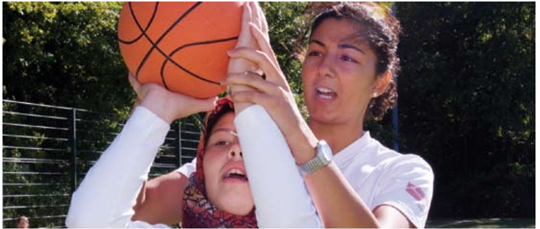
Wir sind starke Mädchen: Auf dem Sportplatz und im Leben

„Weg vom Rand und rauf aufs Spielfeld“ – unter diesem Motto starteten Nike und die DKJS bereits 2003 das Programm MädchenStärken. Nun geht es in die Verlängerung: So wird die Stiftung über weitere vier Jahre neue Projekte fördern, die sich dem Sport und seiner das Selbstbewusstsein stärkenden Wirkung widmen. Denn MädchenStärken wirkt gegen geschlechterspezifische Benachteiligungen und will ein modernes und selbstbewusstes Rollenverständnis vermitteln. Boxen, Fußball oder Capoeira – Mädchen werden angespornt und profitieren nicht nur in der Freizeit, sondern auch in anderen Lebensbereichen von ihren untypischen Hobbies. Die neu ausgewählten Projekte bekommen neben