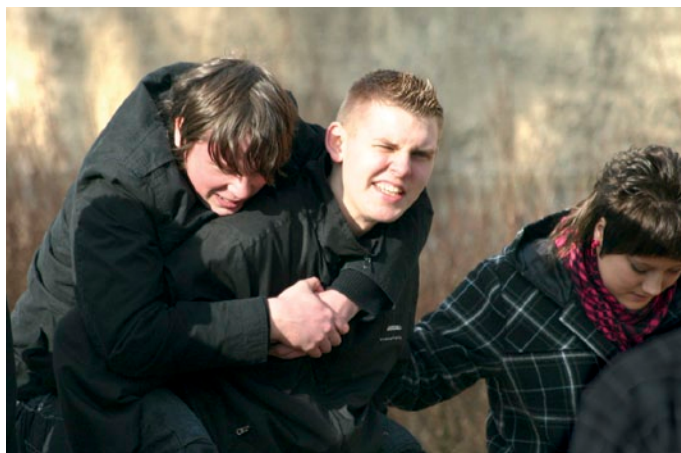
Sachsen und Hessen: Camps für den Sprung in die nächste Klasse

et. Ein ganzes Maßnahmenbündel wurde angeschoben: u.a. kümmern sich regionale Netzwerkstellen gegen Schulversagen um engere Kooperation zwischen Schule, Jugendhilfe, Kommunen und Schulaufsicht. Sie organisieren zusätzliche Bildungsangebote und Coachings, die auf die Besonderheiten und Bedürfnisse der Region zugeschnitten sind.