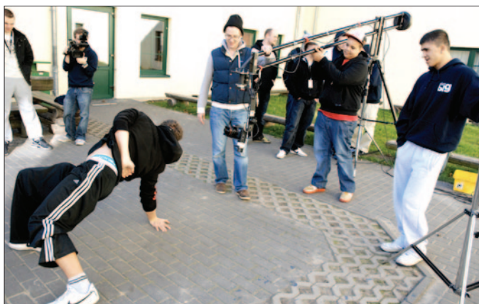
Ein Video für den Jugendclub drehen, einen Spendenlauf an der Schule organisieren - bei Think Big werden Ideen Wirklichkeit.

Mit Think Big können sie groß denken und es sich und anderen