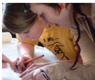
Zwei Jugendliche zeichnen im Freizeitzentrum Kyritz ihre täglichen Wege nach.

Abends die Lieblingsdisco erreichen, weniger abhängig von den Eltern sein - die jungen Teilnehmerinnen und Teilnehmer der sechs Ideenwerkstätten von JugendMobil hatten zum Thema Mobilität viele Wünsche, aber auch eigene Ideen. Den Fahrausweis nicht nur für den Schulweg, sondern auch in der Freizeit nutzen können, eine bessere Auskunft im Internet - das waren einige ihrer Vorschläge, wie sie künftig besser unterwegs sein