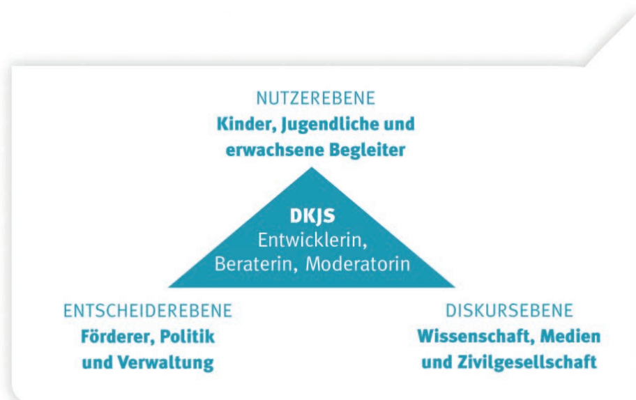
Das Handlungsdreieck der DKJS

Ganztagschulen lernen am besten von Ganztagschulen. Denn so unterschiedlich die Rahmenbedingungen auch sein mögen: Die Pädagoginnen und Pädagogen stehen vor ähnlichen Herausforderungen und haben die gleichen Fragen. Daher setzen wir in unseren Programmen auf schulische Netzwerke, in denen multiprofessionelle Teams sich regelmäßig austauschen und voneinander lernen können. Seit 2004 haben wir über 2.500 Ganztagschulen in derartigen Netzwerken unterstützt.